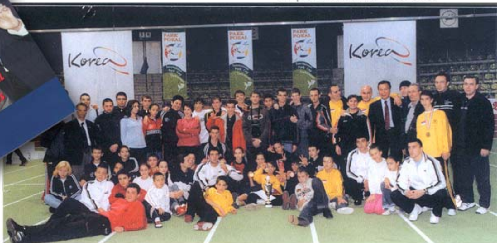
Team Serbien Montenegro